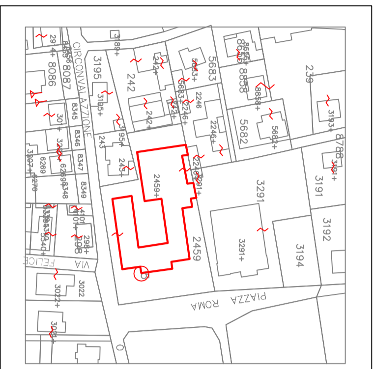
ESTRATTO MAPPA CATASTALE